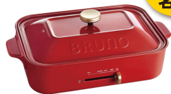
BRUNO コンパクトホットプレート (レッド)