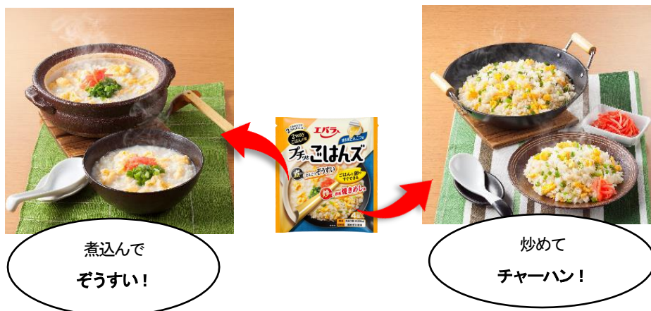
プチッとごはんズ チキントマト味

ポーション容器に液体調味料が入っているので、ごはんに混ぜりやすく、味のムラなく仕上がります。ごはんとお卵、本品に水を加えて煮込めば“ぞうすい”、“リゾット”などの煮込みごはんが、希釈せずに炒めれば“チャーハン”などの炒めごはんが5分でできあがります。