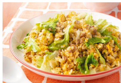
ひき肉レタスチャーハン