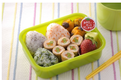
カラフル肉巻きお弁当