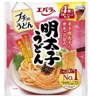
プチッとうどん 明太子うどん

エバラ食品は「こころ、はずむ、おいしさ。」を提供し、「プチッとうどん」をはじめとした「プチッと調味料」の提供価値をさらに拡大することで、さらなるお役立ちを目指してまいります。